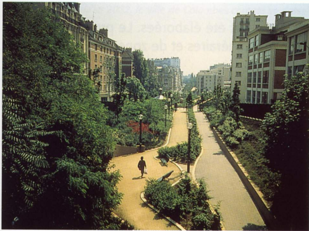
La promenade en tranchée