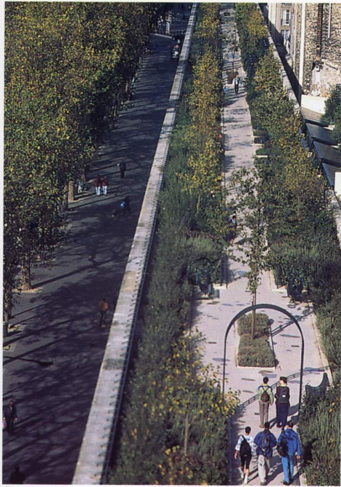
La promenade sur le viaduc