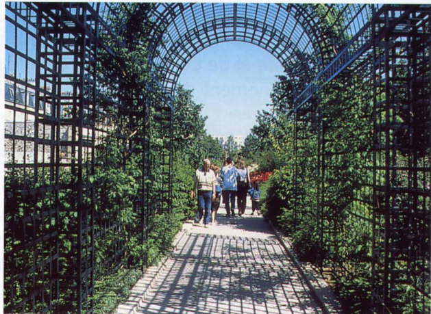
Le jardin de treillage