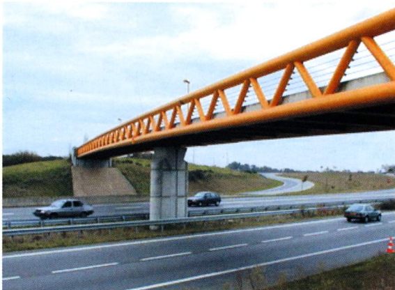
La passerelle piétons-cyclos de la Ville-au-Denis