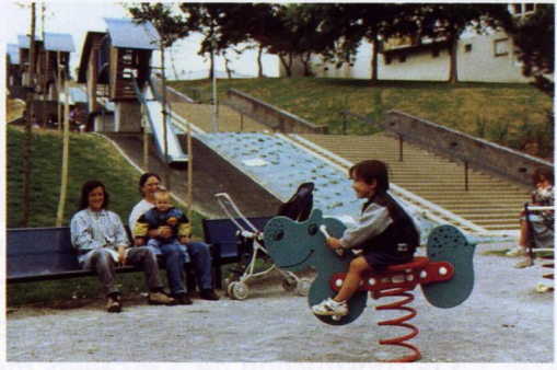
Au pied, un espace pour les tous petits et... leur maman