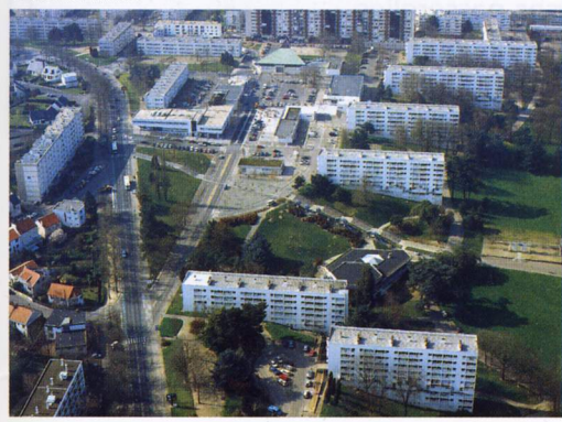
Relier le bas et le haut du quartier