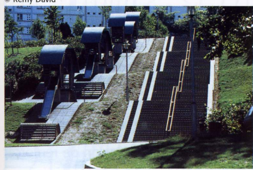
La "Grande descente" et l'escalier des petits