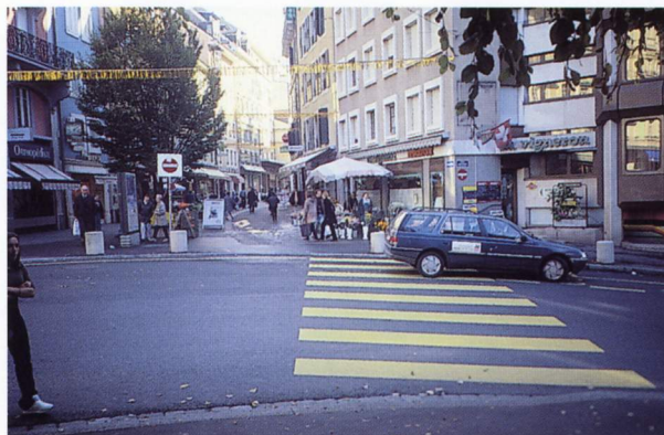
Station taxi au débouché de la rue de l'Alé (extrémité de la zone la plus populaire du réseau piétonnier du centre ville)