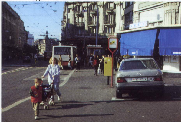
Place Bel Air, les taxis sont directement dans l'espace réservé aux piétons