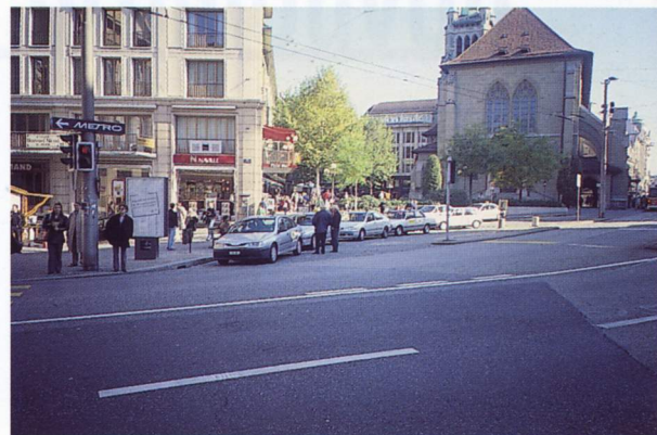
Place St-François, cette station est la plus grande du centre ville, à côté du nœud principal du réseau de bus et en bordure de la zone piétonne