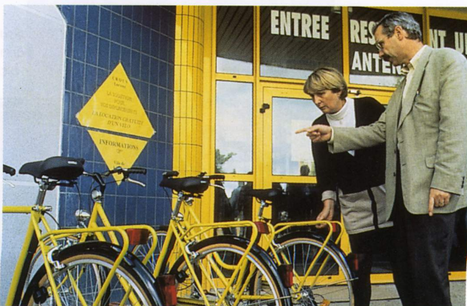
Les responsables municipaux présentent les vélos