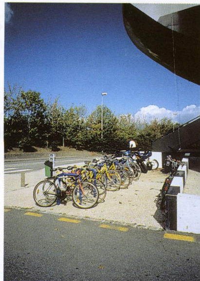
Le parking à vélos d'un bâtiment universitaire