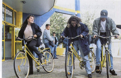
Les premiers tours de roue