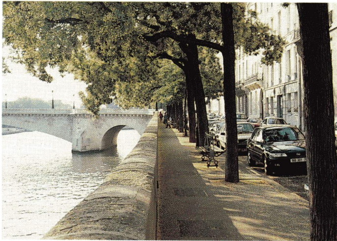
Sur les quais de la Seine, un stationnement longitudinal et un alignement des bancs et des plantations, permettent de dégager un espace confortable pour les piétons, malgré l'étroitesse du trottoir