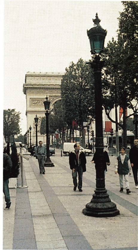
Les Champs-Élysées après réaménagement au profit des piétons