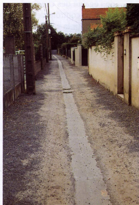
La venelle Bellevoie est en cours de réhabilitation