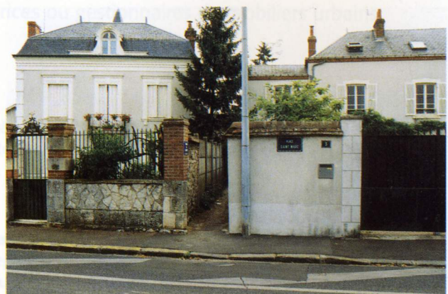
L'entrée discrète de la venelle du Muguet

Municipalité, conseil de quartier, associations de quartier, riverains et propriétaires.