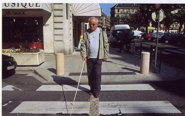
Confort pour tous : élargissements des trottoirs aux traversées, facilité de repérage et de guidage, possibilité de repos