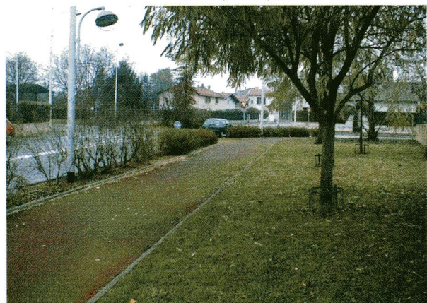
Exemple de profil voirie à 12 mètres

La réalisation du réseau piétons/cyclistes implique un investissement important dans le foncier, notamment en zone naturelle.