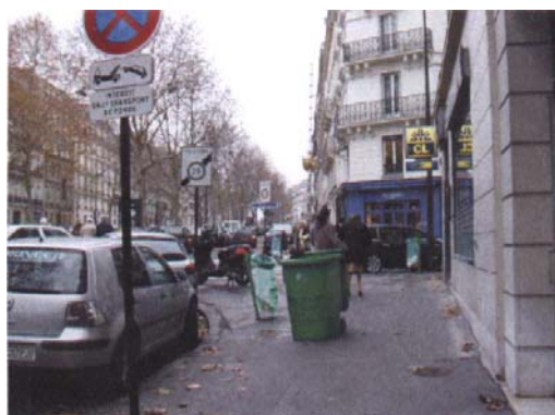
Poubelles encombrant le trottoir