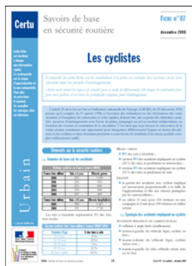
Éditeur : Certu (décembre 2008) en téléchargement gratuit