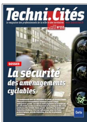
Éditeur : Territorial Presses (2007-2009) en téléchargement gratuit