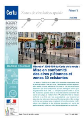
Éditeur : Certu (2008-2009) en téléchargement gratuit