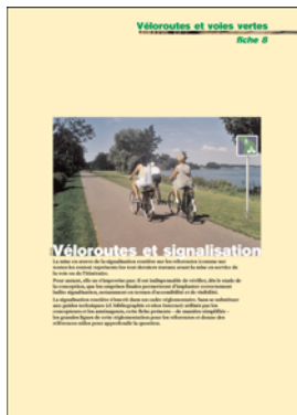
Éditeur : Certu (2001-2009) en téléchargement gratuit