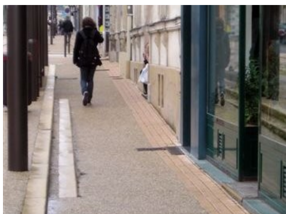
Confort de la marche