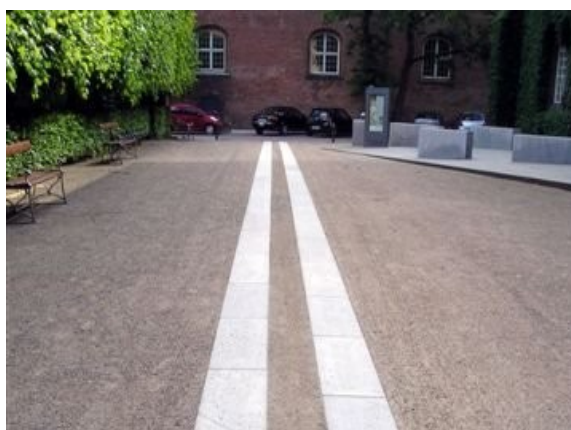
Brèveté des parcours pour les UFR et PAM

Les critères caractérisant la qualité d'un cheminement ou d'un itinéraire piétonnier sont d'abord la brèveté des parcours, la continuité des trajets, la sécurité de tous les usagers, la sûreté des lieux.