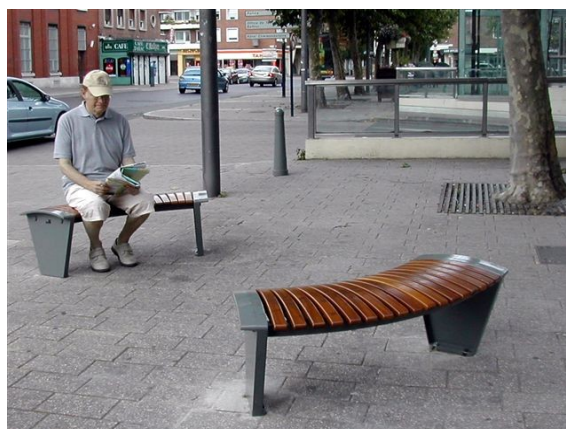
Sûreté des lieux

Ces quatre premiers critères conduisent aux concepts de bande passante et de trajet direct développés dans une fiche complémentaire à celle-ci, et à des méthodes de conception des trajets directs.