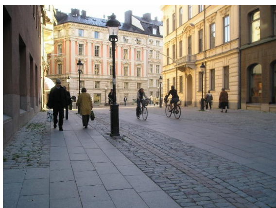
Conception globale de la voirie

A ces dix critères s'ajoute évidemment le respect de la réglementation sur la voirie accessible synthétisée et illustrée dans le dépliant " Une voirie accessible "