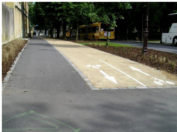
Repérabilité par les PMR dont les PAM

Les critères suivants concernent la repérabilité par les PMR et les PAM, la délectabilité au pied et à la canne, l' attractivité des parcours, la lisibilité des cheminements, le confort de la marche et du déplacement des PMR, UFR et PAM. A ces neuf critères s'ajoute la conception globale de la voirie permettant un partage équilibré de l'espace facilitant les déplacements non motorisés.