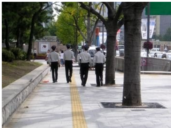
Délectabilité au pied et à la canne