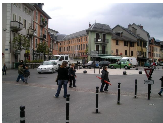
Continuité des trajets