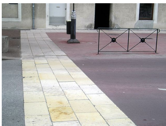
Lisibilité des cheminements