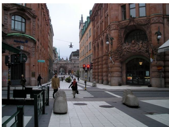
Attractivité des parcours