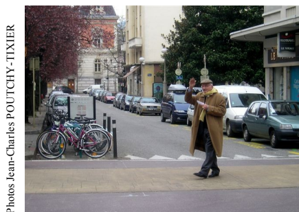
Trottoir traversant Trottoir traversant en giratoire