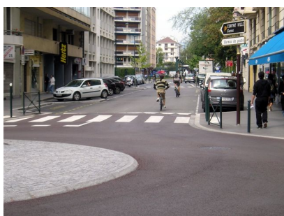
Avancée de trottoir Continuité de bande passante

Voici à titre d'illustration quelques aménagements articulant code de la rue et voirie pour tous.