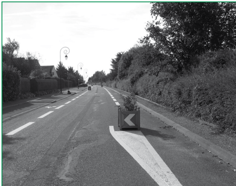
B. Boutry / VéloBuc