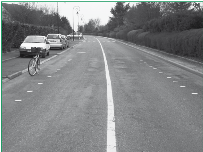
B. Boutry / VéloBuc