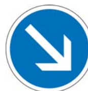
B21a1 Contournement obligatoire par la droite

et un panneau B21a1 ou une balise J5 (si l'îlot est précédé d'une ligne continue) en tête d'îlot séparateur.