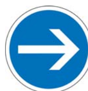
B21-1 Obligation de tourner à droite avant le panneau

La signalisation de guidage comporte un panneau B21.1 sur l'îlot central (lorsqu'il est infranchissable) face à chaque entrée,