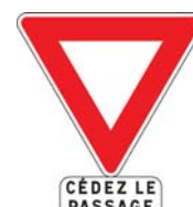
AB3a Cédez le passage à l'intersection Signal de position

La signalisation de guidage comporte un panneau B21.1 sur l'îlot central (lorsqu'il est infranchissable) face à chaque entrée,