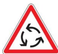
AB25 Carrefour à ses giratoires

La signalisation de priorité se compose du panneau AB25 (obligatoire) en annonce et du panneau AB3a accompagné de sa ligne d'effet.