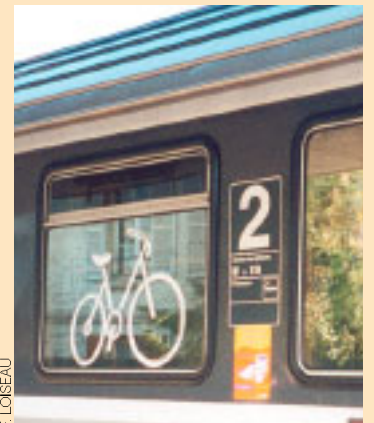
Logo vélo des TER (à gauche, région Centre, à droite, Nord - Pas de Calais).