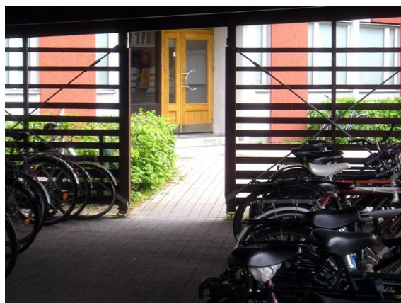
Abri ajouré près de porte d'entrée collective