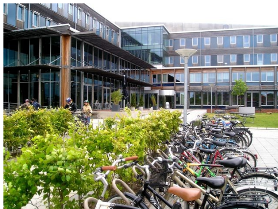
Parc à vélos et piste cyclable publique