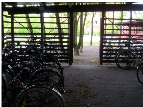
Abri en bois sur espaces communs privés