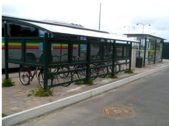
Combinaison abris bus - vélos en périphérie