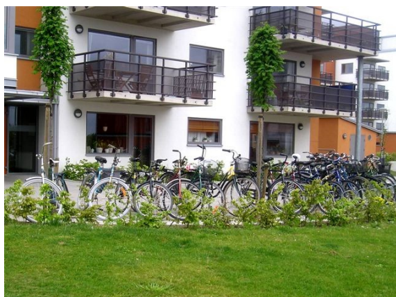
Vélos en pied d'immeuble sur espace privé

Des pays européens voisins mettent en oeuvre des solutions peu coûteuses permettant de relever ce défi. Les illustrations qui suivent présentent quelques solutions intéressantes, non pas aux fins de les copier, mais pour faciliter le dialogue et la mise en oeuvre de solutions localement adaptées.