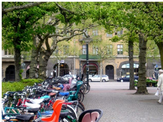
Parc à vélos intégré à une place publique