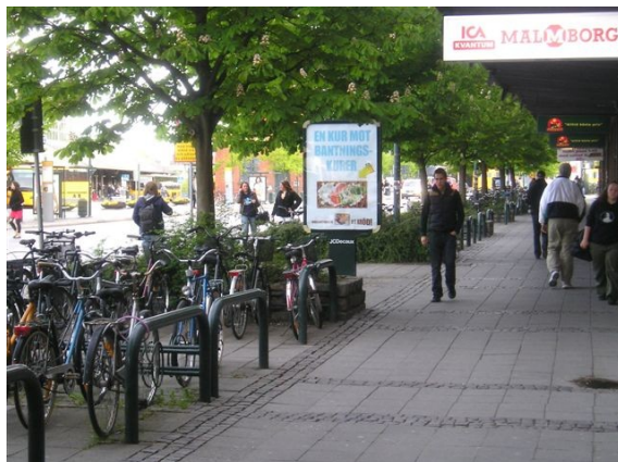
Stationnement public pour usage mixte