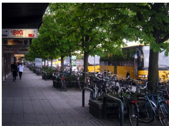
Proximité vélos - habitat - transports publics