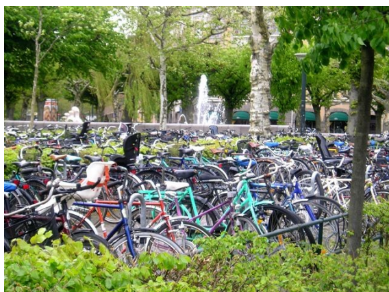
Stationnement de masse organisé et intégré