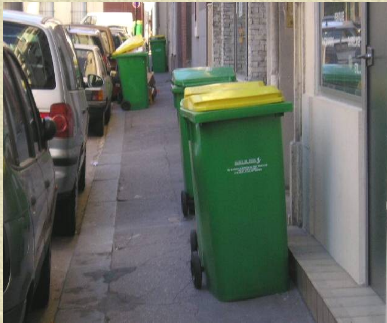
Photo 1 : Poubelles sur trottoirs à Paris, avec nombre multiplié par le tri sélectif