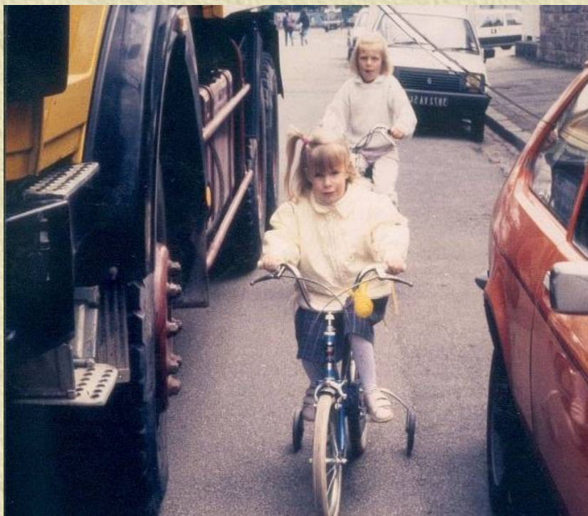
Photo 1 : Aux enfants à vélo aussi bien qu'aux poids lourds , aux voitures et aux piétons

La voie publique est destinée au public, à TOUS les publics