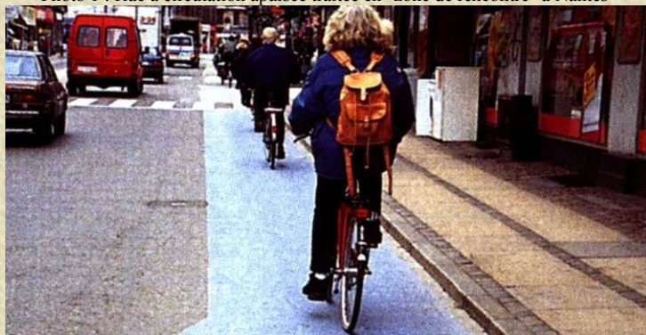
Photo 3 : Marquage des cheminements cyclistes et piétons au Danemark