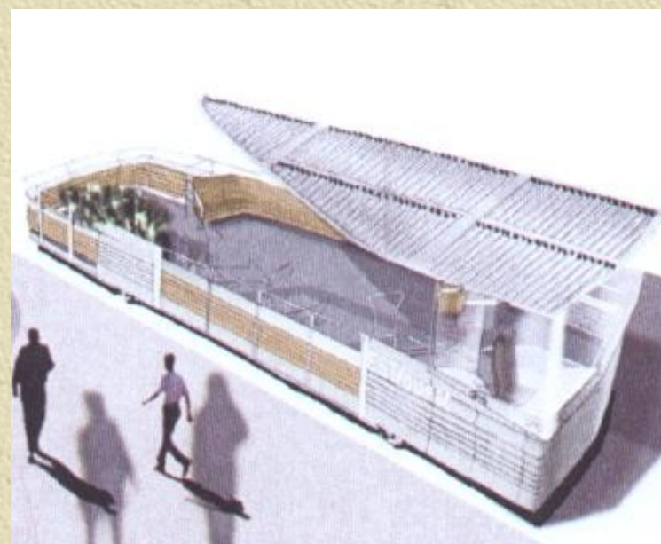
Photo 2 : Projet d'extension mobile de trottoir

« Le transport public, ça doit être le prolongement mobile du trottoir »