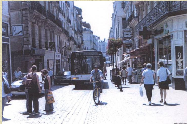
Photo 1 : Rue à circulation apaisée traitée en "zone de rencontre" à Nantes