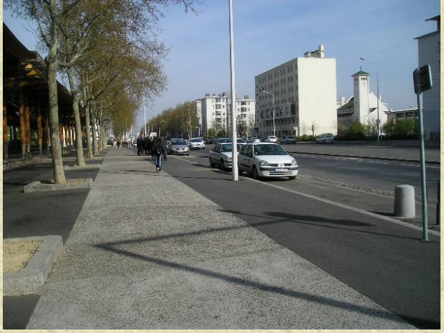
Photo 2 : Restructuration des espaces publics et des cheminements à Lyon