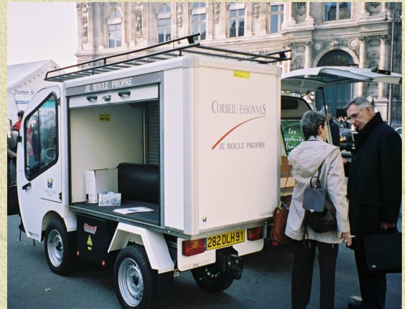
Photo 2 : Fourgon électrique à rideaux pour livraisons en centre ville à Corbeil