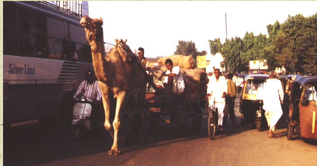
Photo à Delhi : la cohabitation en sécurité d'un grand nombre d'utilisateurs est avant tout une question de respect mutuel

Sécurité et cohabitation sur la voie publique au-delà des conflits d'usage