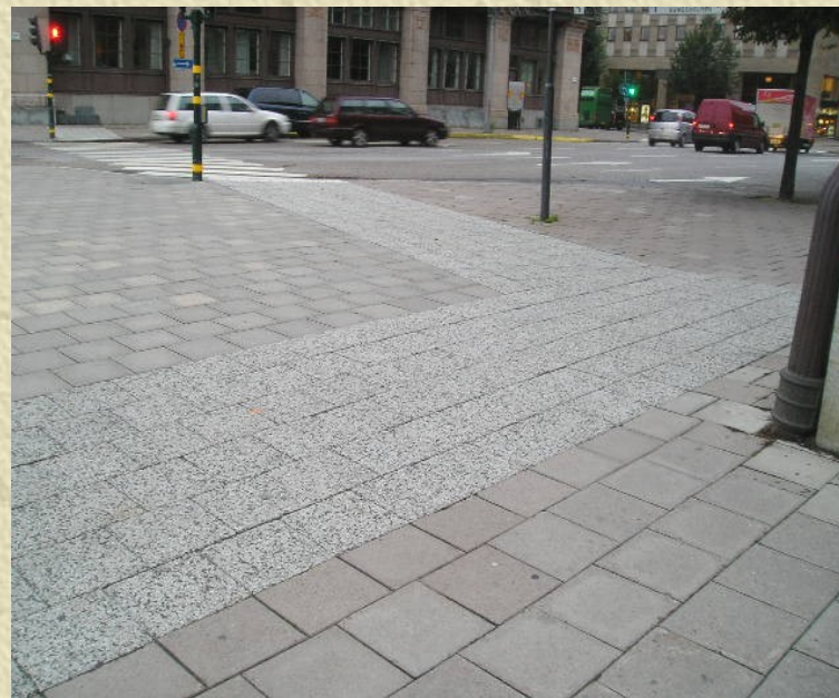
Photo 2 : Continuité de cheminements piétonniers à Stockholm praticables à toutes les PMR