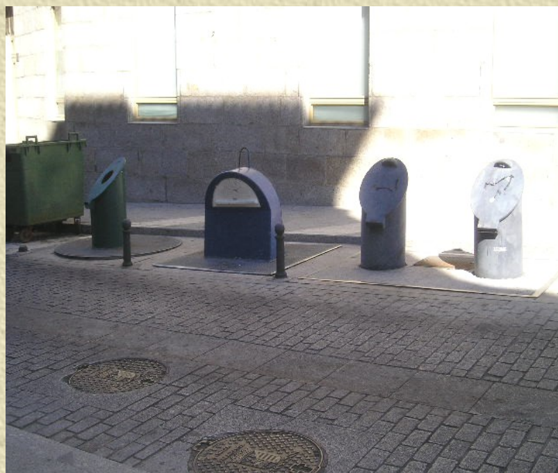
Photo 1 : Conteneurs enterrés de tri sélectif des déchets à Salamanque