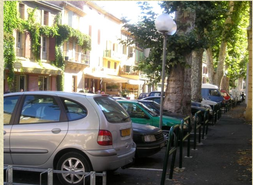
Photo 2 : Stationnement perpendiculaire sous platanes à Jouques (Bouches-du-Rhône)

... et stationne donc et encombre pendant plus de 95 % de son temps