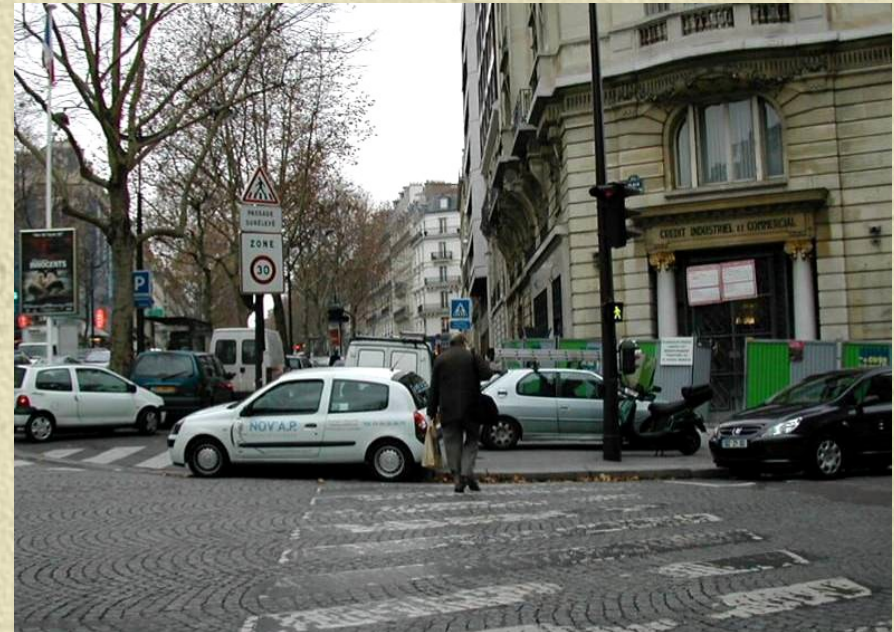
Photo 2 : Trottoirs de l'avenue Marceau à Paris en 2004, impraticables aux PMR