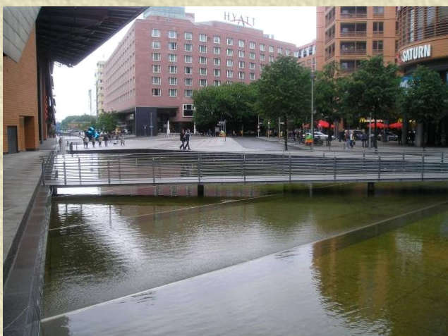
Photo 4 : Requête de la vie urbaine place Marlène Dietrich à Berlin