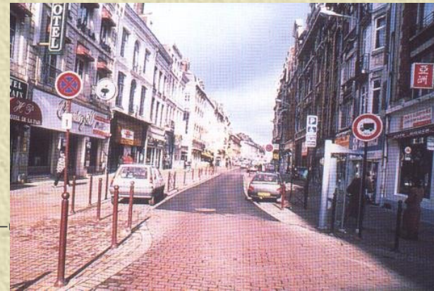
Lille : rue de Paris