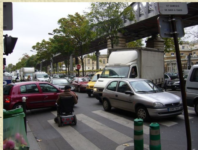
Photo de traversée de boulevard en fauteuil : Changer le concept de normalité Prendre en compte dès le départ les publics auxquels on ne pense pas d'emblée

Sécurité et cohabitation sur la voie publique au-delà des conflits d'usage