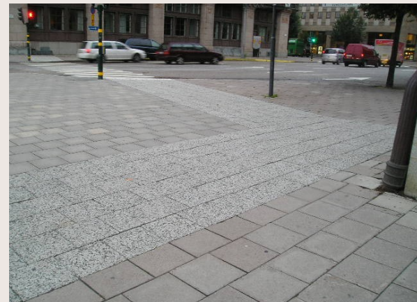
Stockholm : revêtements guides