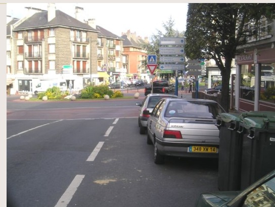
Lisieux : poubelles sur chaussée