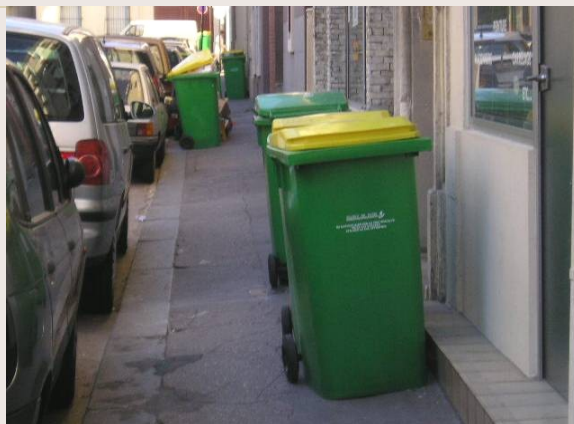
L'encombrement des trottoirs