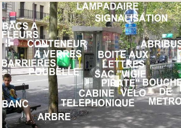
L'encombrement des trottoirs