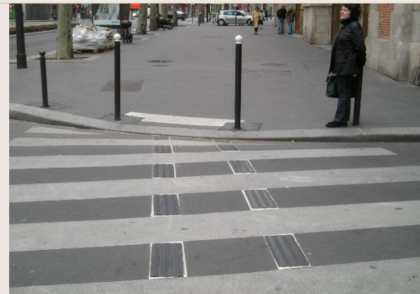
Paris : bandes guides