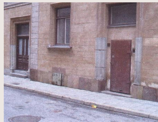
Stockholm : locaux de regroupement