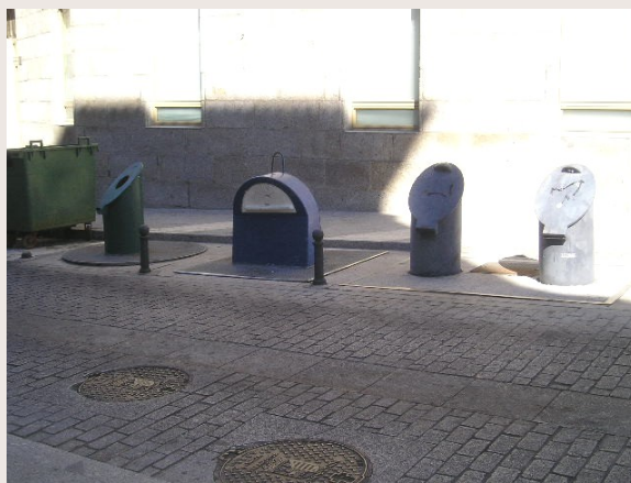
Salamanque : tri sélectif enterré